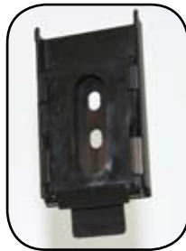
Ménsula de Doselera (VB09)